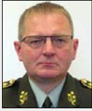
BG Petr ŠNAJDÁREK

Náčelník Spojovacího vojska, Armáda České republiky