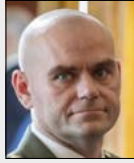
brig. gen. Miroslav FEIX

Velitel, Velitelství kybernetických sil a informační podpory, Armáda České republiky