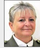
brig. gen. prof. RNDr.